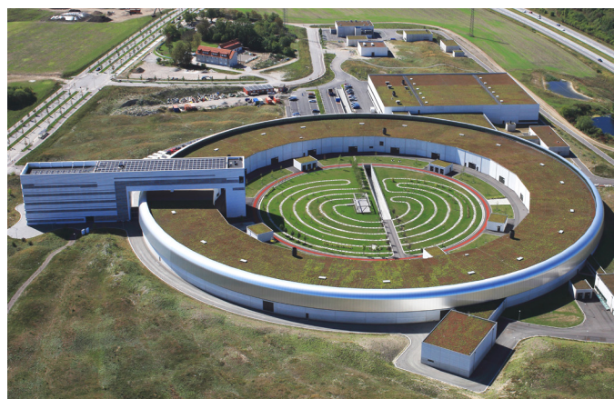
MAX IV-laboratoriet i Lund är ett exempel på en testbädd i laboratoriemiljö.

I Vinnovas behovsinventering identifierades 190 potentiella test- och demonstrationsmiljöer, varav 145 kartlades genom en enkät. I Nordiska ministerrådets rapport identifierades (med ett grövre urval baserat på NACE klassificering) 2 527 potentiella miljöer, men av de 243 svar man erhöll uppfyllde endast 132 respondenter de uppställda kriterierna, vilka kartläggningen baseras på. Det stora skillnaderna mellan studierna gör därför det svårt att skatta den verkliga omfattningen med stor säkerhet.